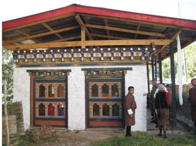
Die neu errichteten Mönchsquartiere auf dem Gelände des Chuckchi-Lhakhangs.

lich König Jigme Khesar Namgyal Wangchuck von der Bevölkerung verehrt wird und ebenso beeindruckend, wie sich das Königreich im Himalaja an einem solchen Tage darstellt.