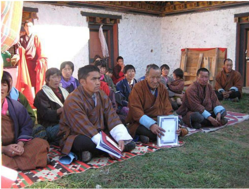
Die Dorfbevölkerung vor dem Küchenhaus.